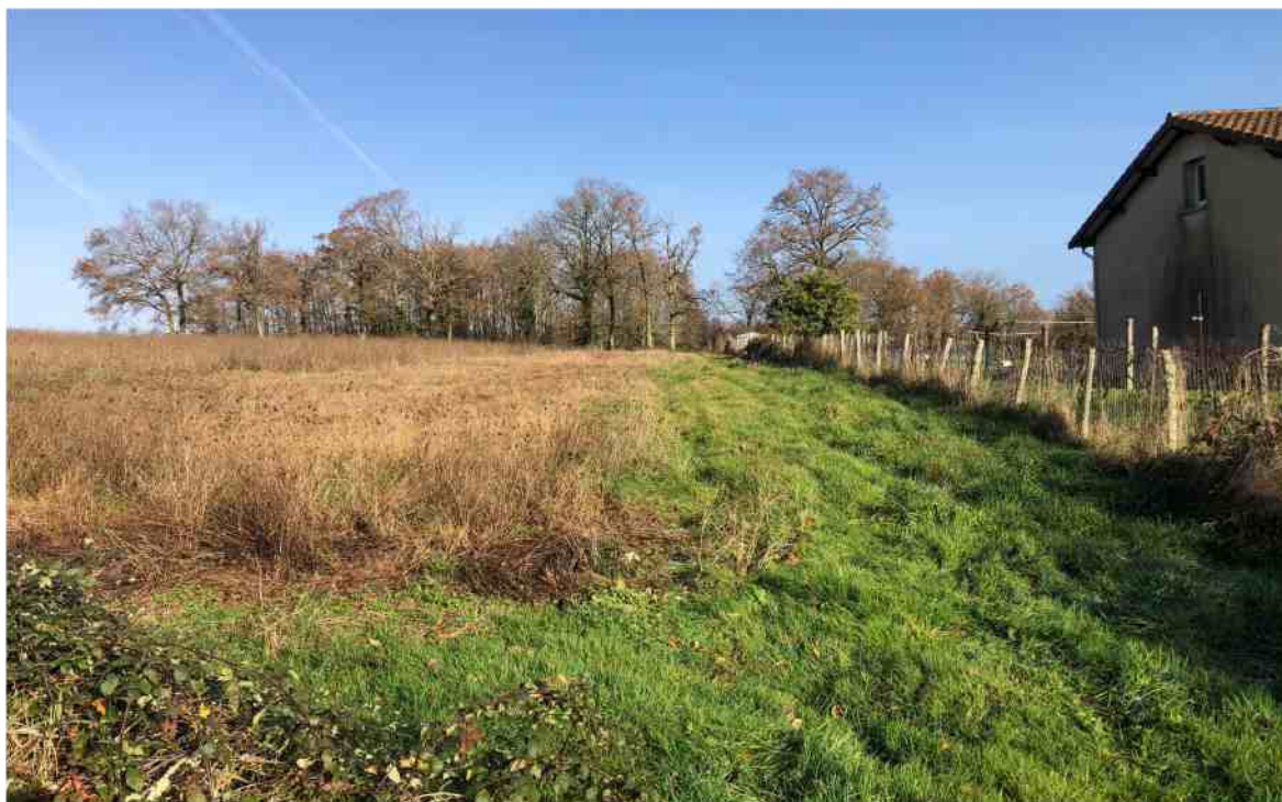
Ce terrain de six hectares est la première parcelle charentaise concernée par l'opération de reboisement de l'entreprise EcoTree.

La première forêt signée par l'entreprise EcoTree va voir le jour à Confolens. Avec un total de 1 800 hectares plantés depuis sa fondation en 2014, la société bretonne franchit la frontière charentaise, en plein cœur de la Charente limousine. D'une superficie de 6 hectares, ce grand projet se situe dans une terre agricole qui n'était plus exploitée depuis plusieurs années. L'agriculteur propriétaire du terrain a donc décidé, pour faire vivre son terrain, de confier sa gestion à l'entreprise sylvicole. EcoTree, contacté par la Safer (Société