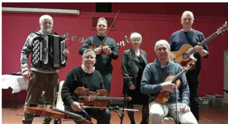
Les deux groupes de musique ayant animé le réveillon panier à la salle du Moulin, avec la référente du Centre social. CL

victuailles, ont été la clé du succès de ces réveillons ayant rassemblé 150 fêtards à la salle du Moulin, à Confolens. Des fêtards adeptes de danses traditionnelles, animées par les musiciens de Projet Rustik et Duo Ondes d'Oc. Il y en avait autant à la Maison du temps libre à Ansac, là où DJ Small proposait un autre style de musiques dansantes.